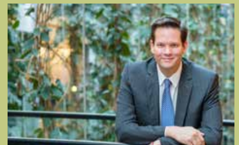
Lukas Mandl: Der Niederösterreicher in Europa