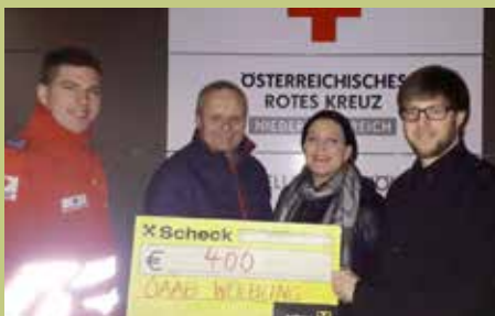
Spendenübergabe an das Rote Kreuz