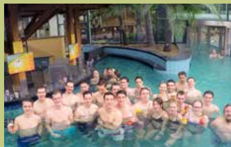
JVP-Ausflug nach Bad Schallerbach